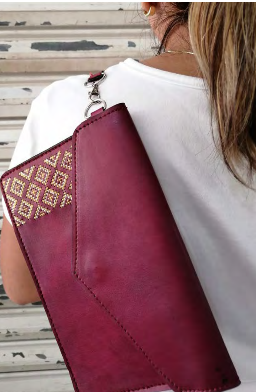
Color: vino Modelo Rombos